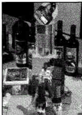
Vendre... les images de célébrités décédées.

dont le rôle est de faire passer le mort à un état détaché mais surtout de débarrasser le vivant de son chagrin. Là, on rejoint par le texte la petite exergue qui précède l'exposition et où on voit quelques objets ethnologiques au sens étroit du terme: quelques vitrines pour illustrer les pratiques funéraires sur les cinq continents. EW