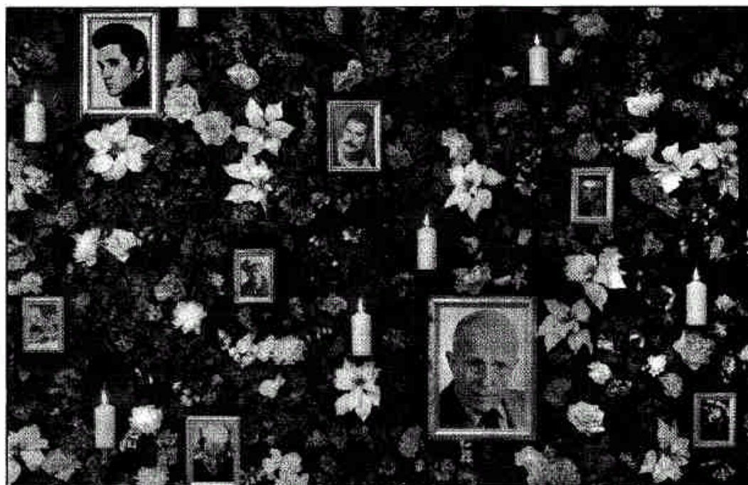
Cultiver... le souvenir des humains disparus.

L 'imédiat dilaté où nous vivons écrase notre mémoire.