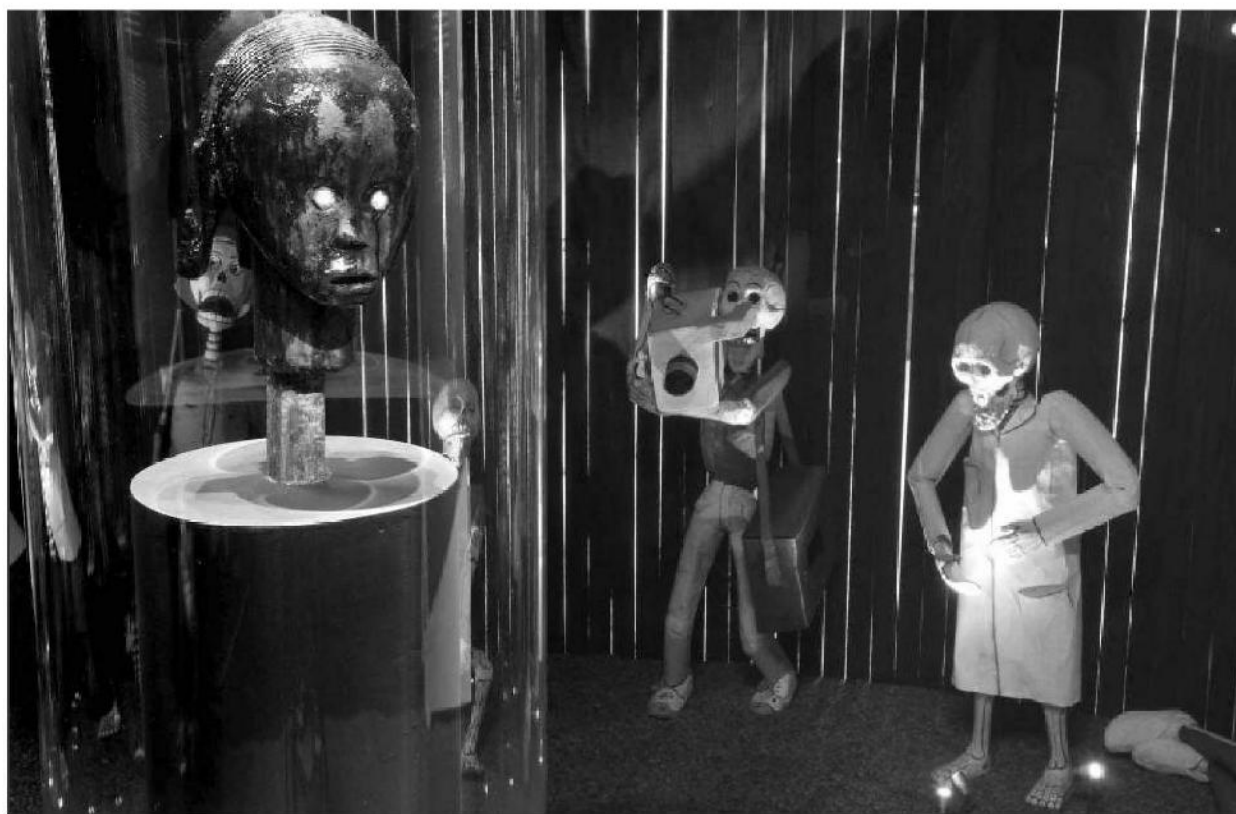
En adaptant les rites à notre monde, les jeunes rendent intelligible le pire chaos. Et dynamisent la possibilité des relations intergénérationnelles.