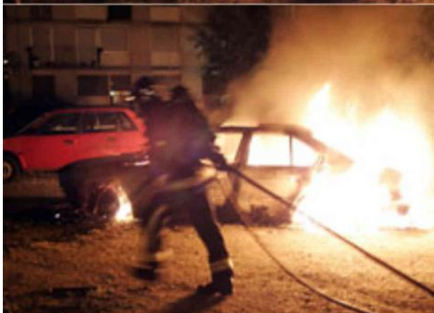
Voitures incendiées à Montfermeil, en juin 2006.