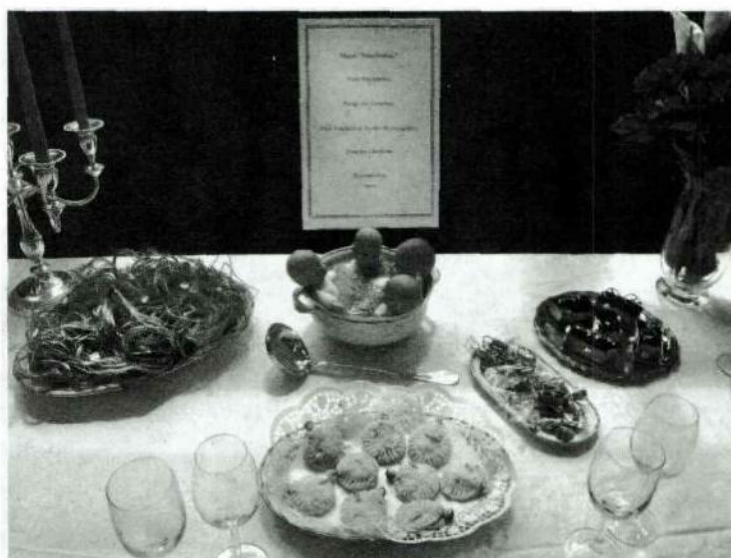
Neuchensoi ou quand les étudiants en ethnologie se préoccupent d'appellations d'origine contrôlée.