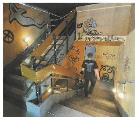
TADS L'un des scénarios créés sur lesquels le Musée d'ethnographie de Neuchâtel nous invite à poser, peut-être, un regard.

Neuchâtel, Musée d'ethnographie, jusqu'au 1er mars 2009. www.men.ch