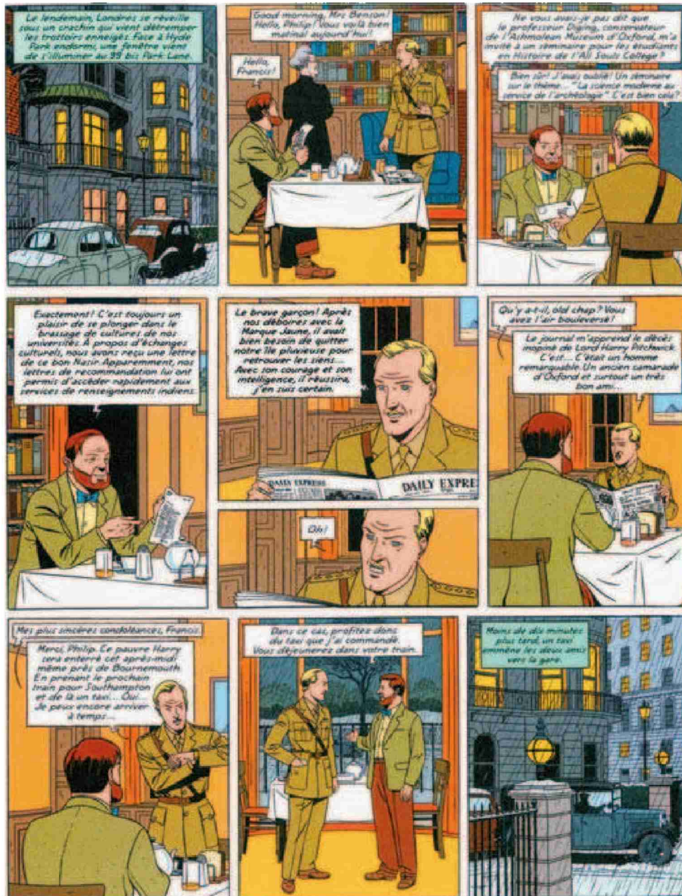
Une planche du dernier Blake & Mortimer «Le Serment des cinq lords». André Juillard et Yves Sente signent leur cinquième album de la série. SP