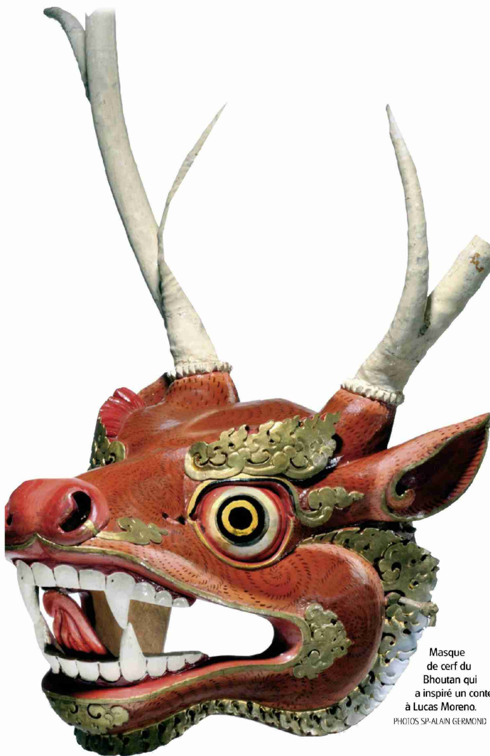
Masque de cerf du Bhoutan qui a inspiré un conte à Lucas Moreno.

N° de thème: 38.17 N° d'abonnement: 38017 Page: 13 Surface: 61'398 mm 2