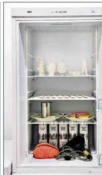
Vue partielle de l'exposition Hors-Champs. Différentes architectures des zones polaires servent de décors aux questions posées. Un frigo pour conserver quoi? Ce qu'on garde pose la question de ce qu'on rejette. ARCHIVES

> Exposition Le Musée d'ethnographie de Neuchâtel s'intéresse au hors-champs