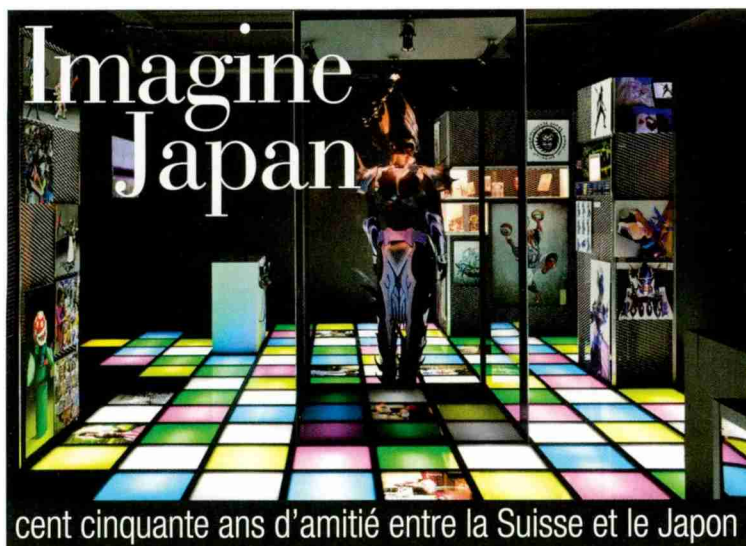
"Imagine Japan" présente des aspects variés du Japon, des mangas aux divertissements populaires.

Le Musée d'ethnographie de Neuchâtel fait honneur au Japon jusqu'au mois d'avril 2015. Sa nouvelle exposition est consacrée aux cent cinquante ans des relations entre la Suisse et l'Archipel.