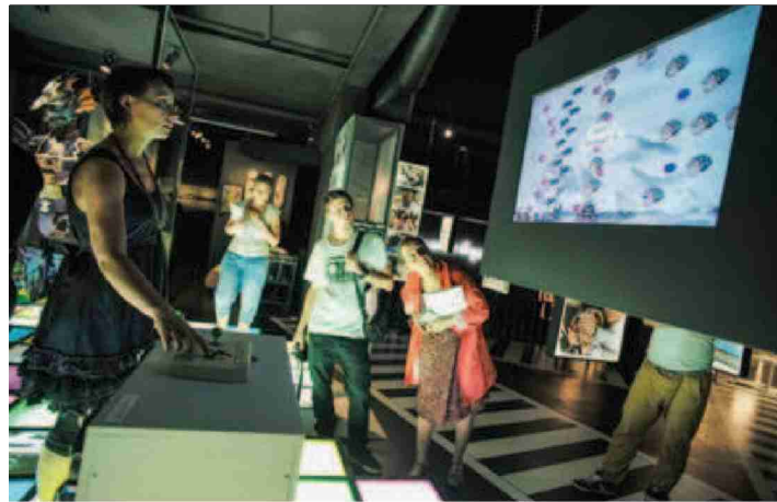
Le public peut tester un jeu vidéo conçu par quatre Lausannois. CHRISTIAN GALLEY

N° de thème: 038.017 N° d'abonnement: 38017 Page: 15 Surface: 95'899 mm 2