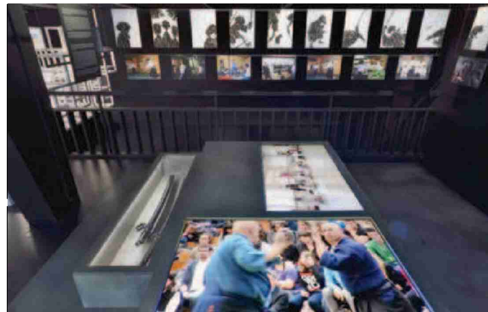
Arts martiaux et planches de la BD, «Samourais...» de J.P. Kalonji.