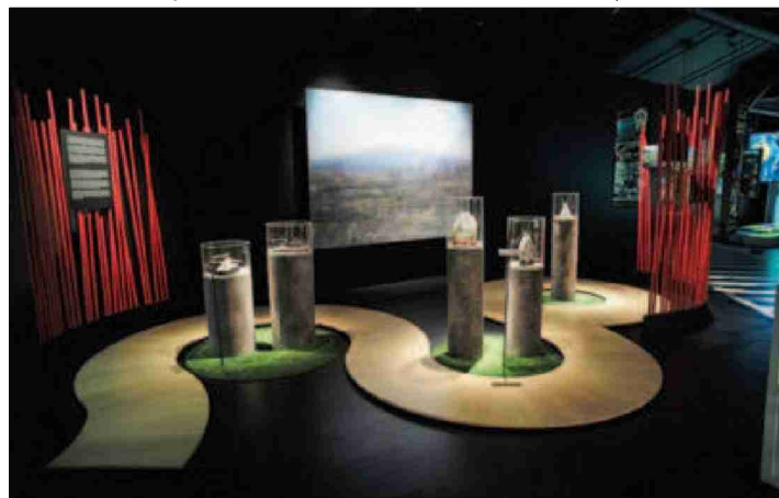
Pierres suiseki et photographie du Mont Fuji par Corinne Vionnet. CHRISTIAN GALLEY