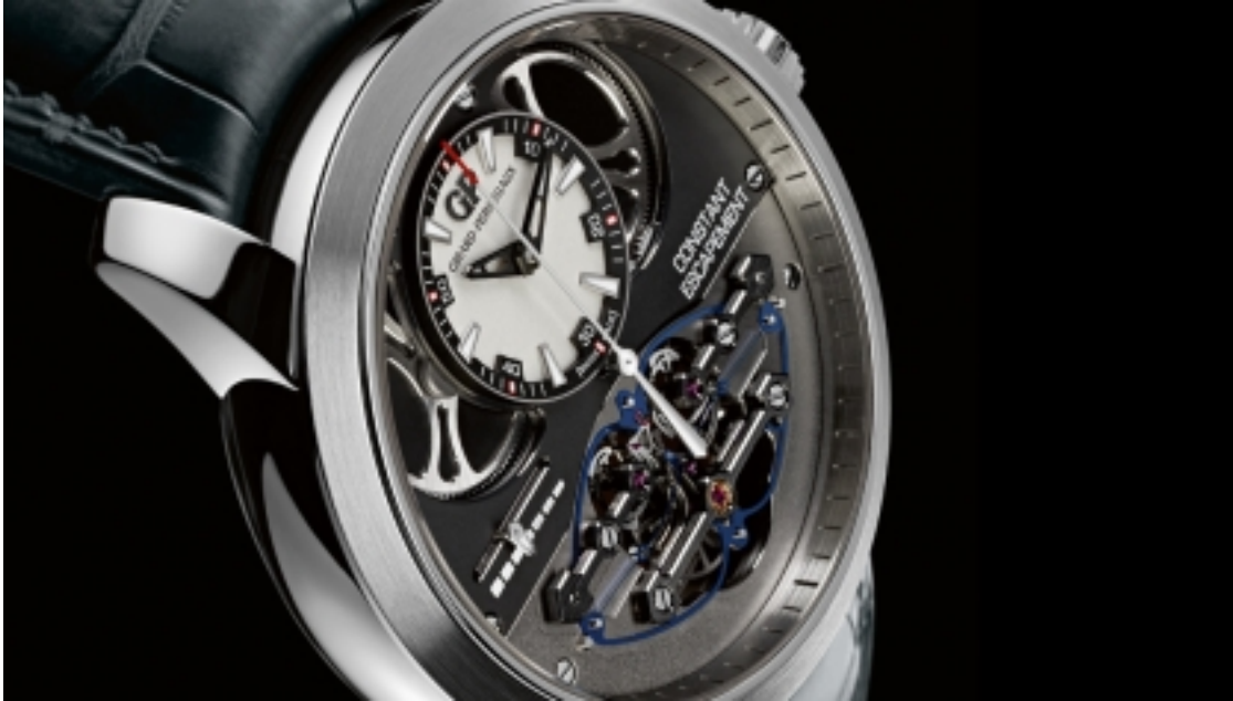
Girard-Perregaux, le nouveau visage