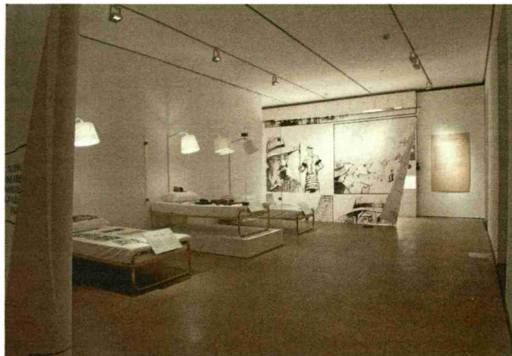
L'apport de la médecine occidentale améliore l'état de santé des populations locales. Mais elle supprime aussi les croyances et pratiques traditionnelles. (Nadine Jacquet)