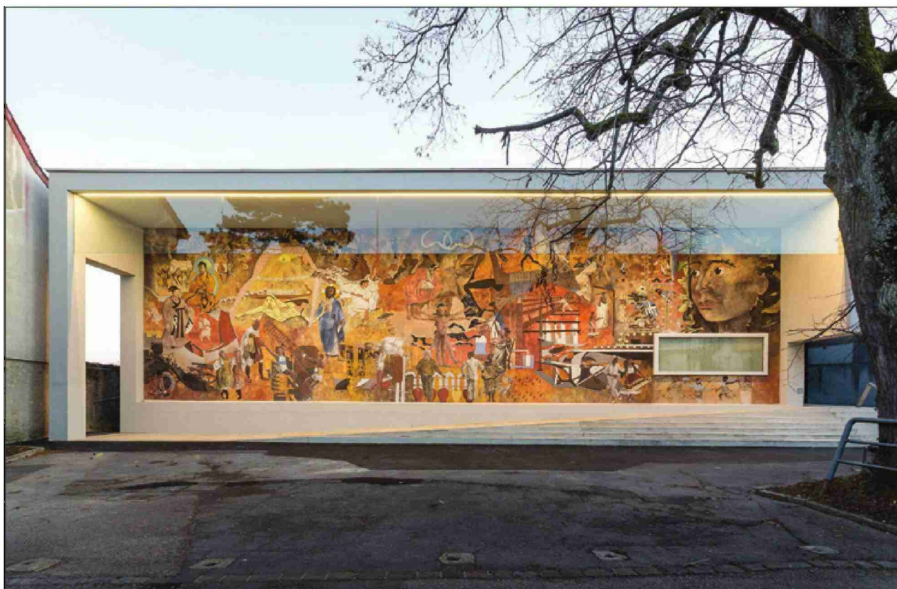
La fresque extérieure de Hans Erni « Les conquêtes de l'homme », qui occupe presque l'entier de la façade nord de la Black box, est désormais mise en valeur par un nouvel éclairage et protégée des intempéries par un couvert.

Après deux ans de travaux, la salle d'exposition temporaire du Musée d'ethnographie, baptisée « la Black box », rouvre ses portes au public. Pour l'occasion, l'équipe du musée a concocté une toute nouvelle exposition qui aborde un thème d'actualité: le tourisme. Intitulée « le mal du voyage: pratiques et imaginaires touristiques », elle questionne notre rapport au voyage. Tandis que les travers du tourisme sont pointés du doigt dans la littérature, la production scientifique et les médias, ses bons côtés sont souvent éludés.