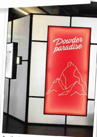
Derrière les paradis touristiques, se cachent parfois des pratiques extrêmes, voire insoutenables.