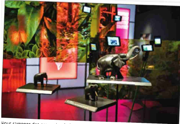
Pour ramener des souvenirs de leur séjour, les touristes prennent quantité de photos, parfois au prix de leur vie, et achètent des objets locaux comme ces éléphants.