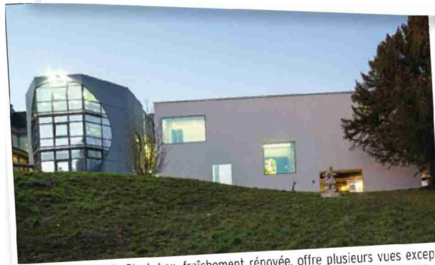
La façade sud de la Black box, fraîchement rénovée, offre plusieurs vues exceptionnelles sur le parc. Ces espaces de respiration ont été utilisés dans l'exposition actuelle.