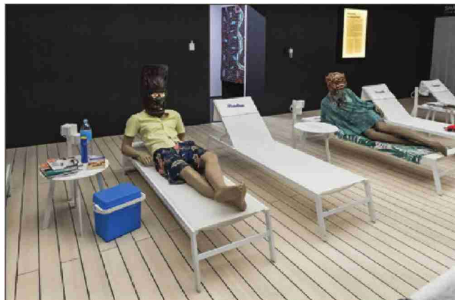
De Portalba à Djerba, des milliers de touristes parcourent chaque année de grandes distances pour bronzer à la plage. (Lucas Vuille - Atelier 333)