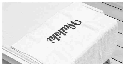
Trois haltes à ne pas manquer lors de l'exposition: L'appétit du monde , Le temple de la morale et Welcome to Everywhere . PRUNE SIMON-VERMOT/MUSÉE D'ETHNOGRAPHIE DE NEUCHÂTEL