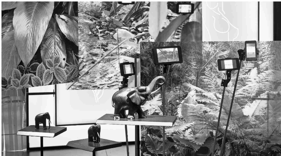
La jungle des images vue par le Musée d'ethnographie.