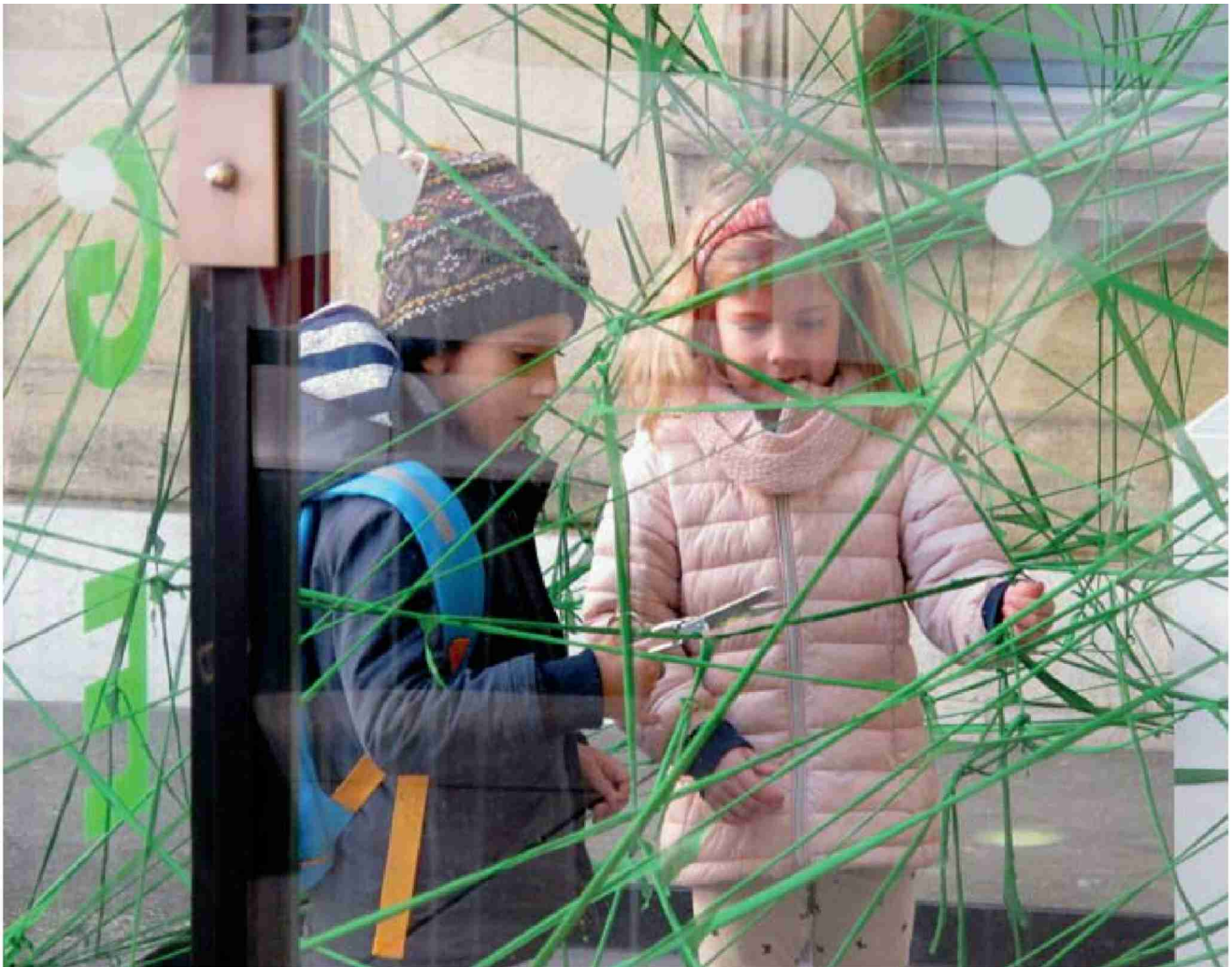
Mardi, les premiers jeunes visiteurs ont coupé symboliquement la plante géante posée à l'entrée du musée. SÉBASTIEN LEHMANN