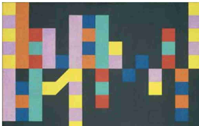
Une «Symphonie de couleurs» de Camille Graeser.